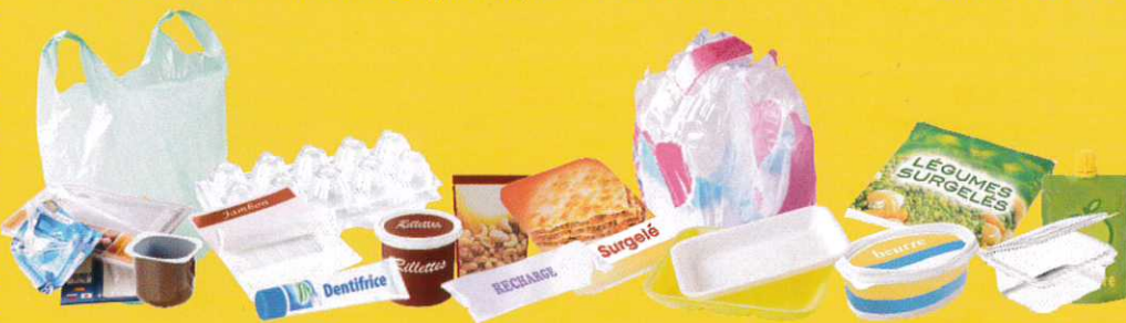
Emballages, barquettes, boîtes et pots en plastiques et polystyrène