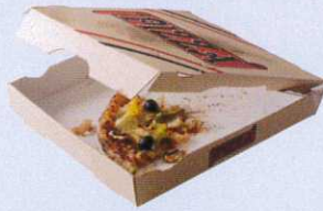
Emballages et papiers souillés