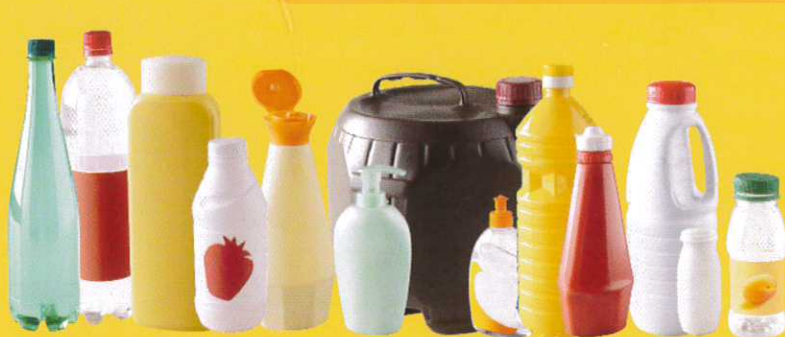
Bouteilles et flacons en plastiques alimentaires