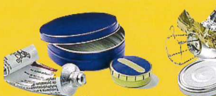
Capsules et couvercles