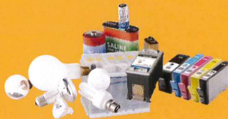
Lampes, piles, batteries, cartouches