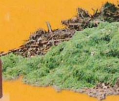
Déchets toxiques : bricolage, décoration, combustibles, produits pour entretien maison, véhicule, ou jardin... Déchets verts