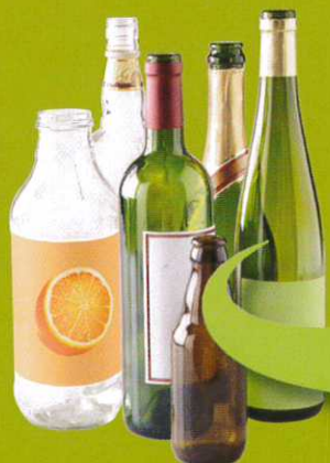
Bouteilles, bocaux, pots en verre