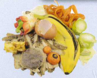
Epluchures, restes alimentaires