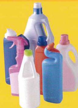
Bidons entretien ménager