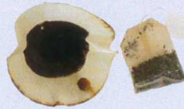
Filtres et dosettes café, sachets d'infusion ou thé